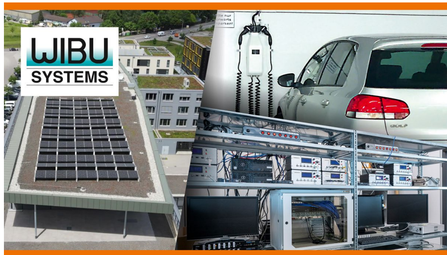
Bild: Wibu-Systems widmet sich dem Umweltschutz: durch von Mitarbeitern geschaffenen Technologie-Innovationen, Umweltbewusstsein bei der Produktentwicklung und Engagement für eine nachhaltige Zukunft der intelligenten Industrie.

5.558 Anschläge bei durchschnittlich 55 Zeichen pro Zeile