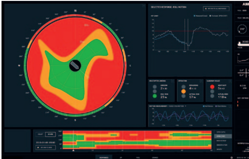
Aan de hand van scheepskarakteristieken en de weers- en zeeomstandigheden voorspelt de software welke bewegingen een schip gaat maken.

nieuwe functionaliteit van hydrodynamische adviesystemen.